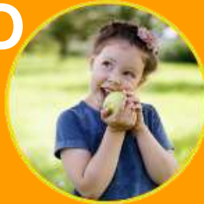
frutta e verdura non lavate