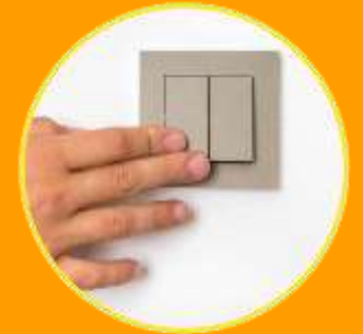
interruttori e maniglie di porte e finestre